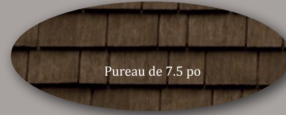
Pureau de 7.5 po