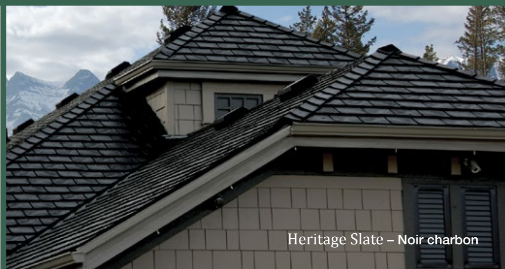
Heritage Slate - Noir charbon