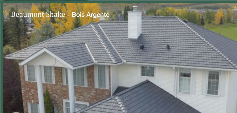
Beaumont Shake - Bois Argenté

EuroSlate® et EuroShake® sont les 2 produits originaux offerts. Cette gamme de produit vous offre un système de verrouillage de tuile "Rainure et languette". Ces panneaux ont une épaisseur de ¾ po à la base et pèse environ 3,4 lbs au pi.ca. Le poids de ces produits correspond au standard et ne nécessite pas de renfort additionnel à votre toiture. EuroShake® offre une apparence de cèdre 'Coupé à la scie' et 'Fendu à la main'. Heritage Slate, Beaumont Shake et Harvest Shake vous offrent aussi un extraordinaire fini et rendement. Ces modèles sont plus minces, environ ½ po à la base et à la fois plus abordable que les produits d'origine. Sur une échelle de prix, ceux-ci sont normalement situés entre le bardeau d'asphalte populaire et les toitures de métal, de cèdre et de composites en polymère.