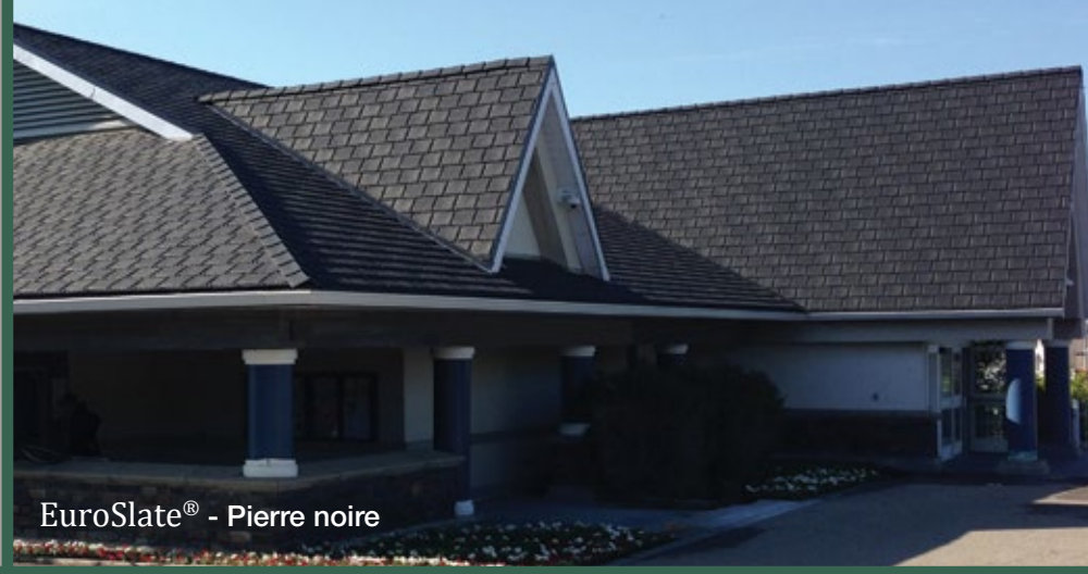
EuroSlate® - Pierre noire

Les systèmes de revêtement de toitures en caoutchouc EUROSHIELD® ont été créés, il y a plus de 16 ans, afin de détourner le problème d'accumulation de pneus usagés dans les sites d'enfouissement grâce au recyclage du caoutchouc. Des années de recherche et développement ont permis de mettre au point une formule unique et gagnante, contenant 95% de matières recyclées dont 70% provient du caoutchouc de pneus recyclés. Le résultat de cela permet de vous offrir le meilleur revêtement de toiture en caoutchouc disponible sur le marché à l'heure actuelle.