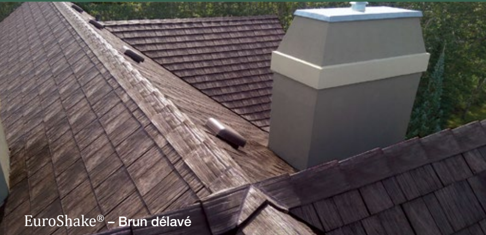
EuroShake® - Brun délavé

EUROSHIELD® vous offre 2 profils d'ardoise... EuroSlate® et Heritage Slate Aussi... EUROSHIELD® vous offre 3 profils de bardeau de cèdres... EuroShake®, Beaumont Shake et Harvest Shake.